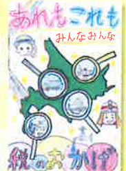
稲積小学校 / 6年生