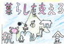
新陵東小学校 / 6年生