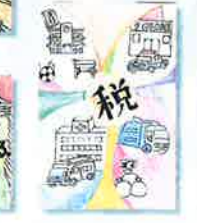
前田北小学校 / 6年生