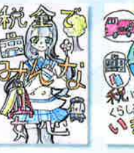
二十四軒小学校 / 6年生