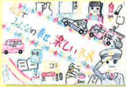
日新小学校 / 6年生