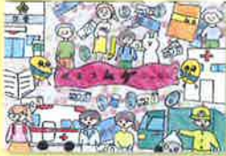
発寒南小学校 / 6年生