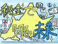
新陵東小学校 / 6年生