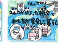
前田北小学校 / 6年生