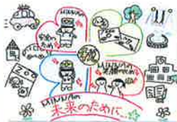
手稲鉄北小学校 / 6年生