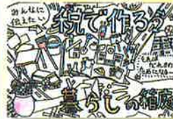
二十四軒小学校 / 6年生