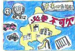
二十四軒小学校 / 6年生