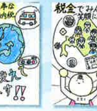
手稲鉄北小学校 / 6年生