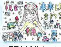
星置東小学校 / 6年生