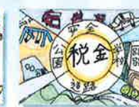
前田北小学校 / 6年生