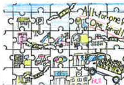
手稲鉄北小学校 / 6年生