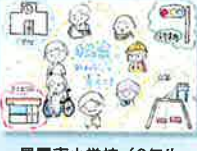
星置東小学校 / 6年生