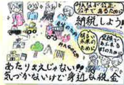
発寒東小学校 / 6年生