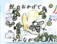
新陵東小学校 / 6年生