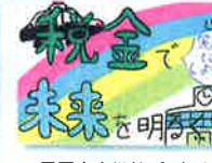
星置東小学校 / 6年生