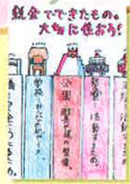
西園小学校 / 6年生