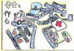
大倉山小学校 / 6年生