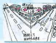
新陵東小学校 / 6年生